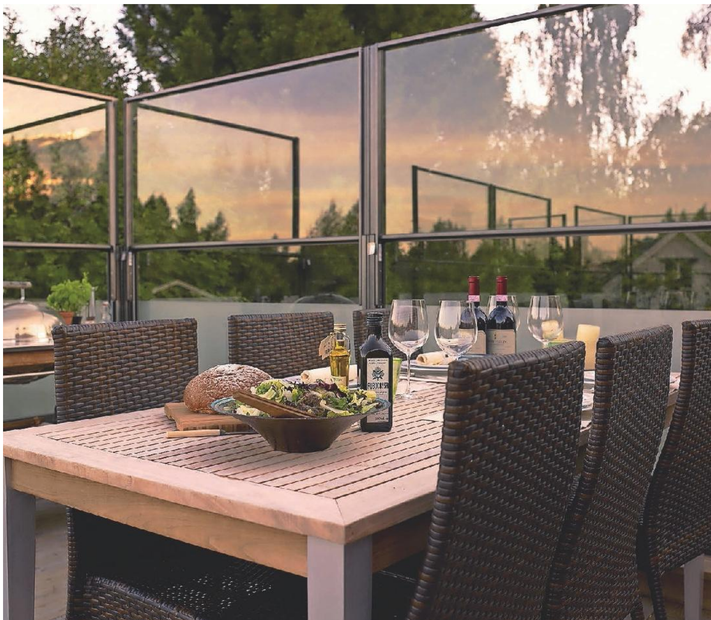
CIT I LAISSE EN NOIR AVEC FILM MAT SUR LA PARTIE FIXE INFÉRIEUR