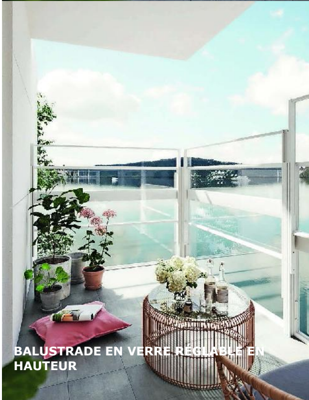
BALUSTRADE EN VERRE RÉGLABLE EN HAUTEUR