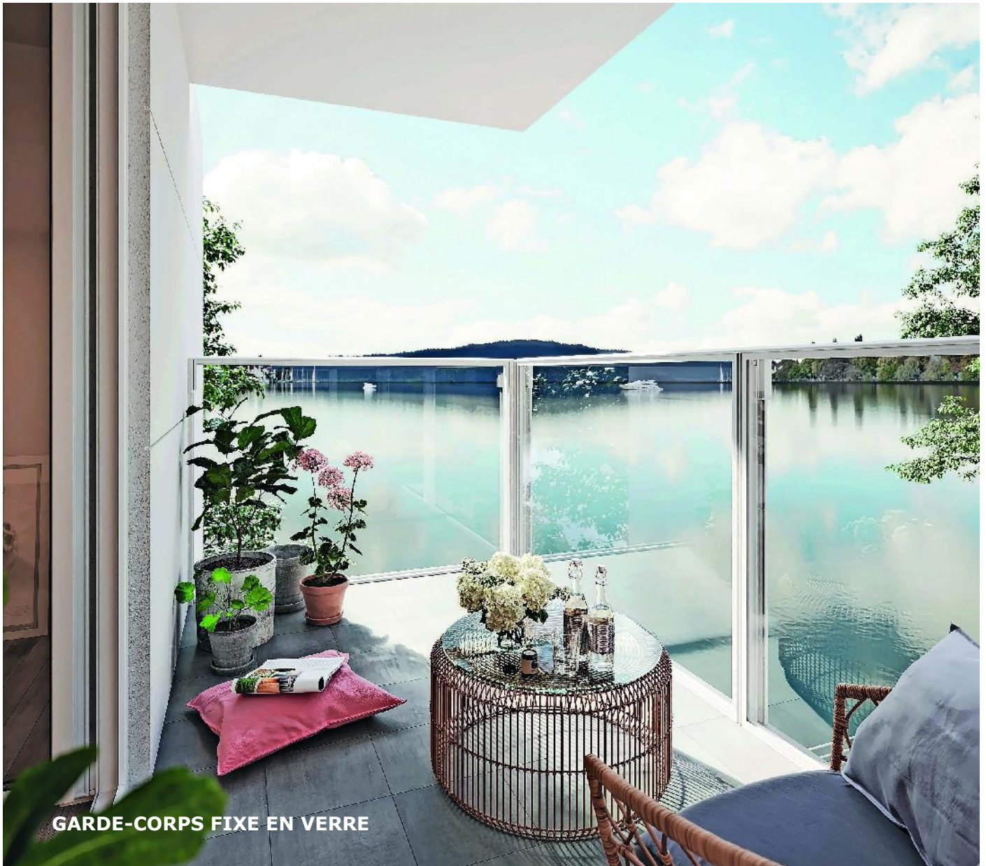
GARDE-CORPS FIXE EN VERRE